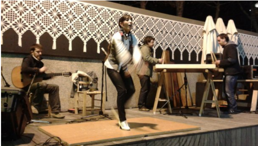
Un momento de la actuación del grupo Berriketan.

Jueves, 3 de Enero de 2013 - Actualizado a las 05:15h